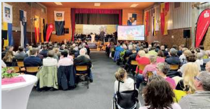
Volles Haus in der Turnhalle des TV 1886 Kallstadt e.V.